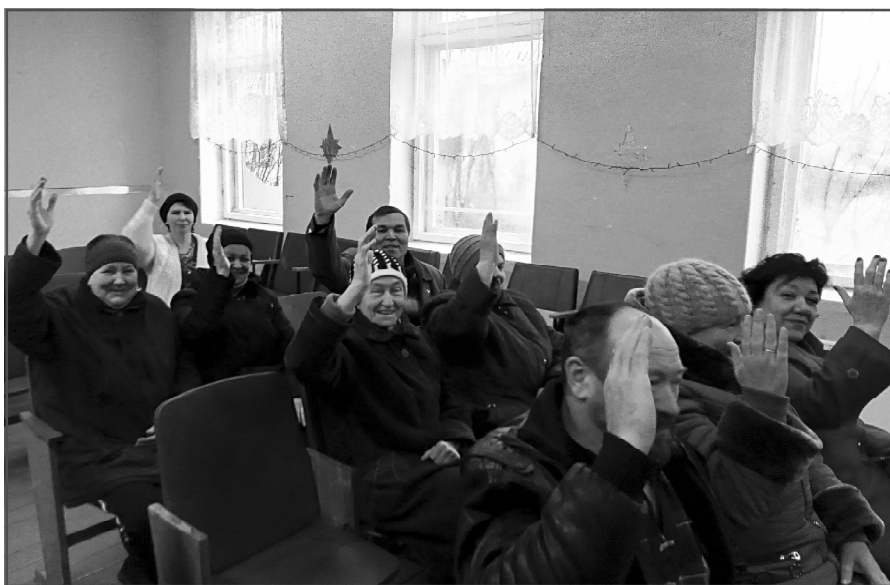
Проект поддержан в Бирючеве...

В Краснознаменском сельском поселении выбрали объекты, планируемые к реализации в рамках ППМИ